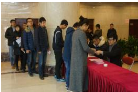
(上接第三版)近万人的选民投票工作。

自9月20日起，在朝阳区选举委员会酒仙桥地区分会的指导下，区人大换届选举工作有条不紊地全面展开。首先，召开了第63选区选举区人大代表专题工作部署会，对本选区的换届选举工作进行了全面的安排部署。其次，在实施选举工作中，工作组全体人员严格按照选举任务和安排，投入到各阶段工作中。通过张贴公告、悬挂横幅等方式对此次换届选举进行了广泛的宣传。同时，做好选民调查摸底、单位划分、代表名额分配等各项准备工作，积极动员广大选民进行登记。尤其11月15日为选民选举投票日，集团作为第63选区的主会场，于当日安排了20多名工作人员配合现场工作。为确保选举工作顺利进行，工作组严格选举程序，采取了划分时间段安排各单位按时间段组织