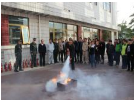
为切实加强园区安全教育工作，提高广大客户和职工的消防安全意识及自救防范水平，实业公司计划今年下半年组织三次园区客户及职工进

行年度消防疏散演习活动，涉及园区所有入住企业。近日，进行了第三次消防演习，在本次演习前，实业公司针对以往演习中存在的模拟起火点不足、宣传教育力度不足等问题，积极听取和采纳了客户建议，制订了周密详实的演习计划及应急预案，并在客户区内进行了广泛的宣传和动员，为演习的顺利完成奠定了良好的基础。