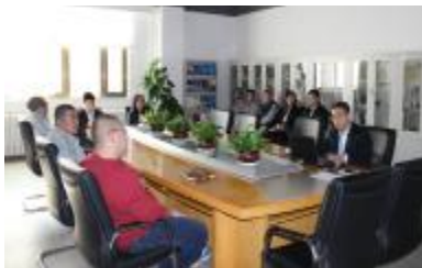
为进一步宣贯企业文化理念，提高新员工同企业共成长、同命运的使命感和责任心，确保实业

文化外化于形，内化于心，固化于制。12月15日，2016年实业公司新员工企业文化宣讲会于B2楼三层会议室正式开讲。