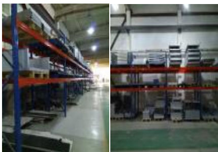
上图:贯彻 5S 精益生产之后

近期,交换设备分公司天津事业部全线推动 5S 管理工作,将“精益生产”理念贯彻到生产全过程中。各生产班组调整为零,全员接受培训,让精益生产的理念深入每位员工的心中,在生产中主动、积极、逐项落实 5S 管理标准。