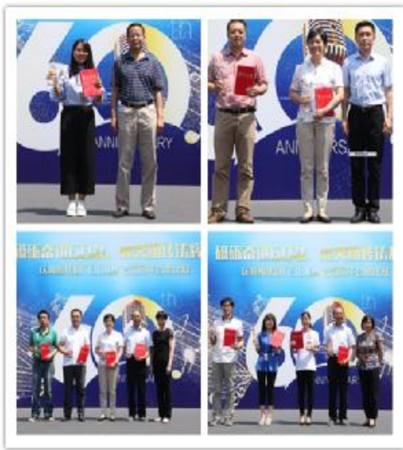
上图:颁奖领导与获奖队伍代表合影