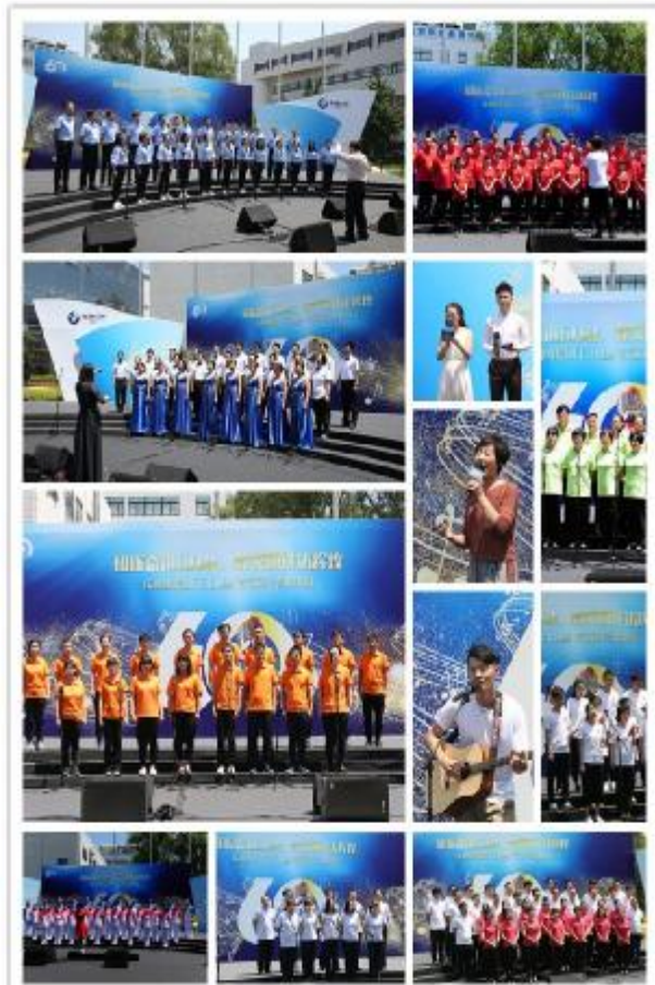
上图:部分比赛现场照片